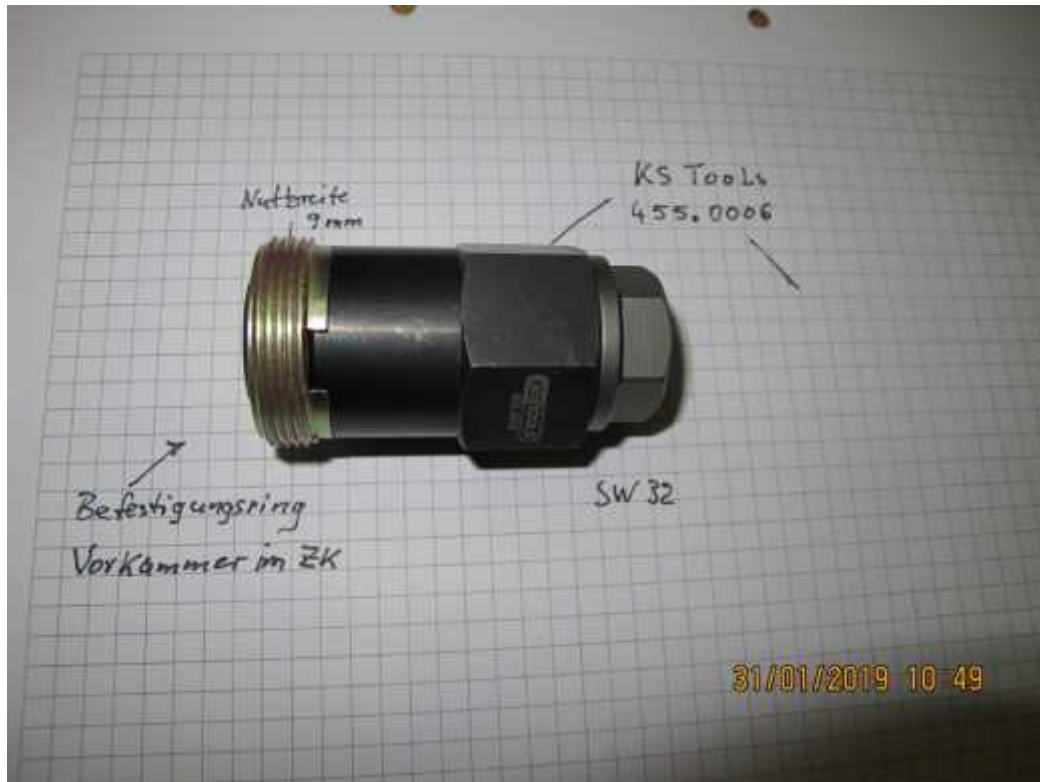
3_pic: Aus-/Eindrehwerkzeug für vorkammer-Nutring in Arbeitsposition