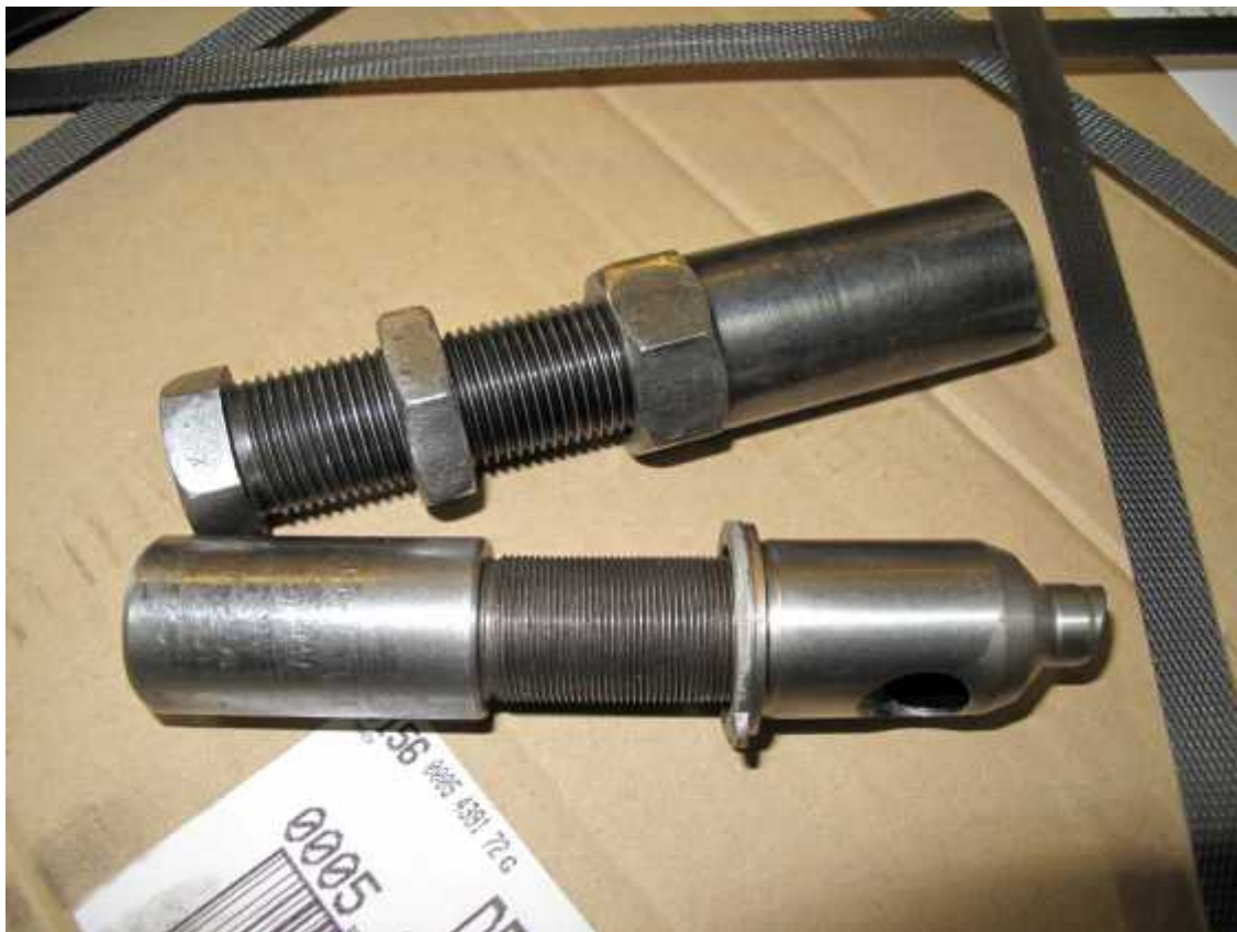
6_pic: Beispiel andere einfache Tools aus der Lehrwerkstatt für den Hausgebrauch