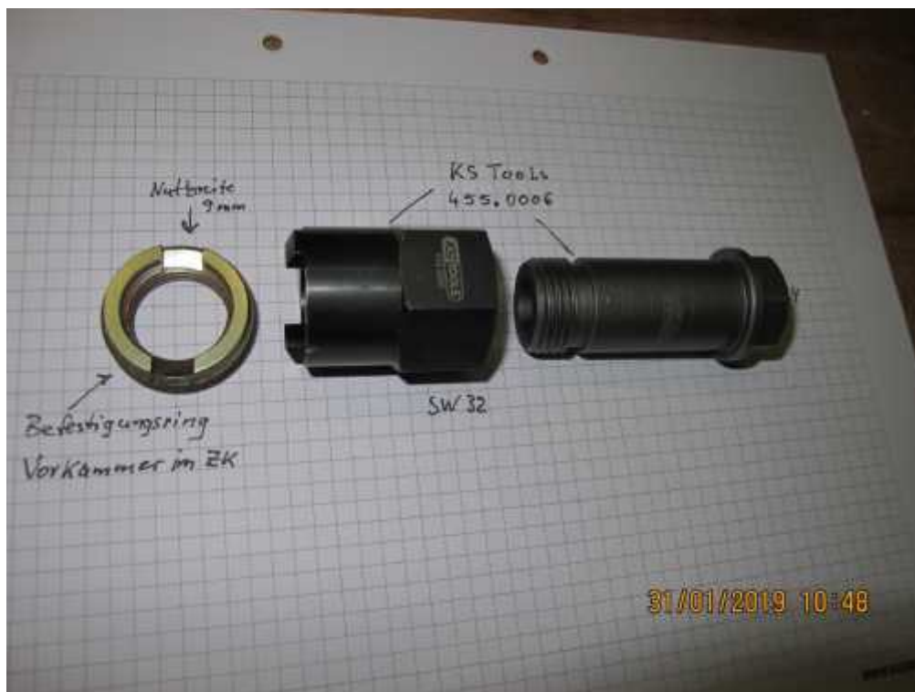
2_pic: Aus-/Eindrehwerkzeug für Befestigungsring der Vorkammer