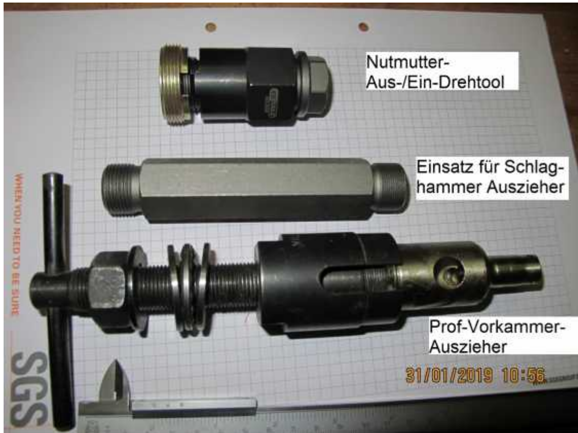
5_pic: In der Mitte der Einsatz für den Schlaghammer Auszieher, einfach aber rustikal.