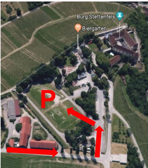
Burg Stettenfels >> Anfahrt zum Parkplatz