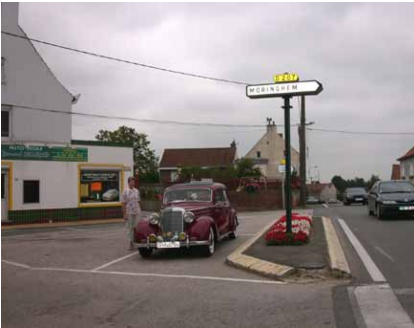
Auf der Fahrt nach Calais. Alles auf Landstraßen.