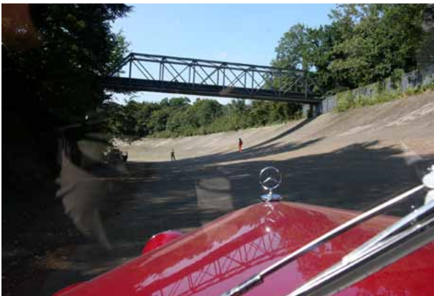
Am achten Tag Brooklands.