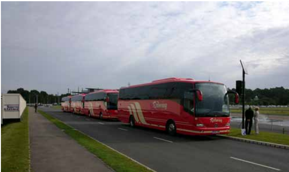
Mit dem Bus- Shuttle geht es zu Leeds Castle