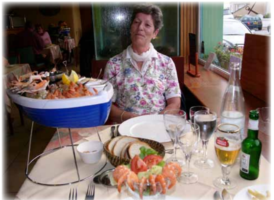
Ein köstliches Nachessen an der Küste bei Sangatte.