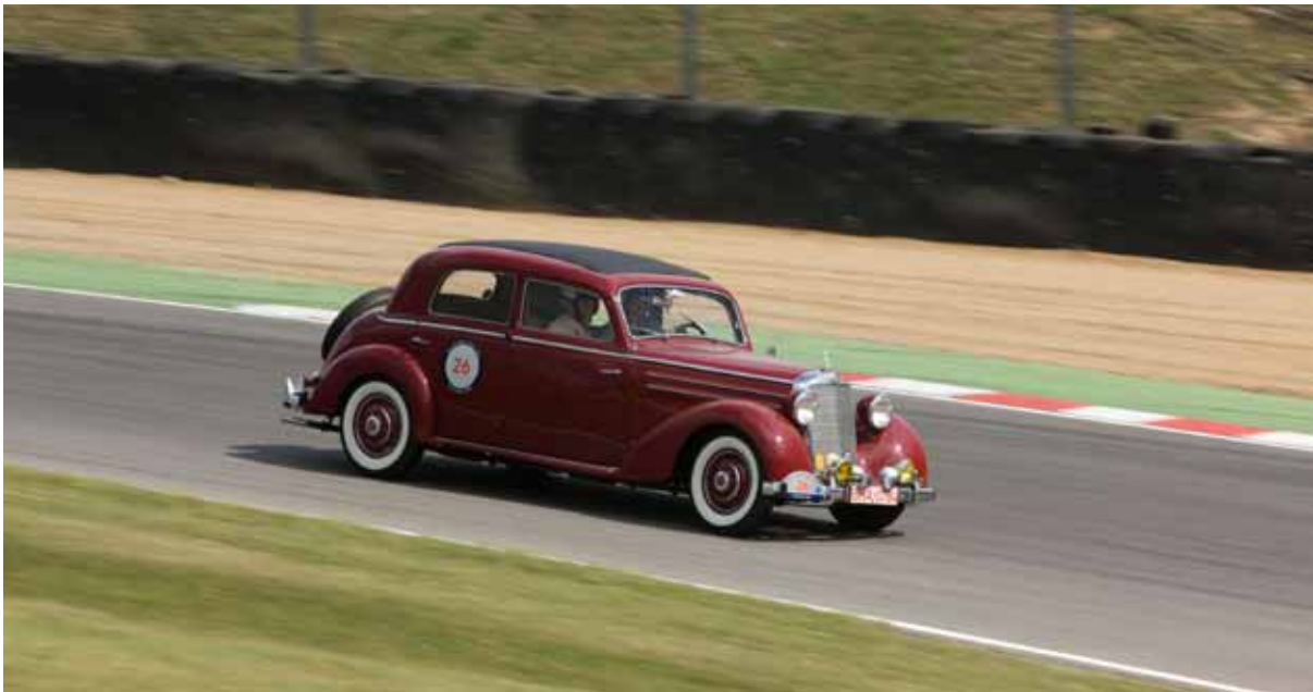
Willi, gib Gas---