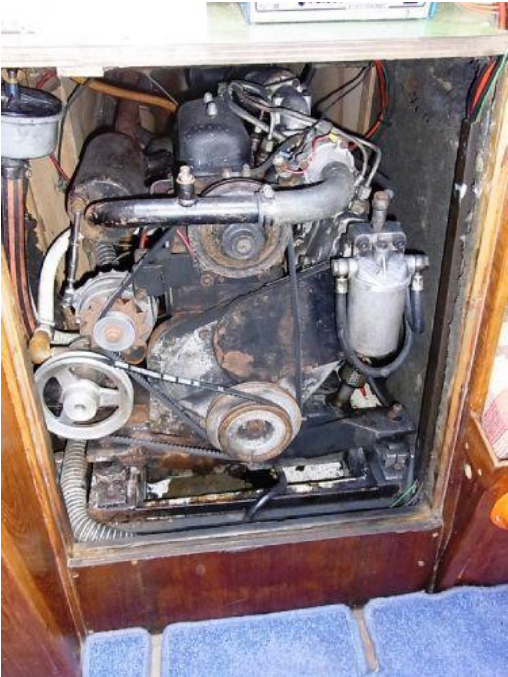
Bilder aus dem Netz