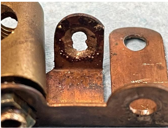
Loch wo der Kontakt war