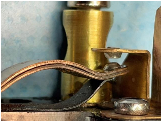
Wieder montiert Abstand eingestellt