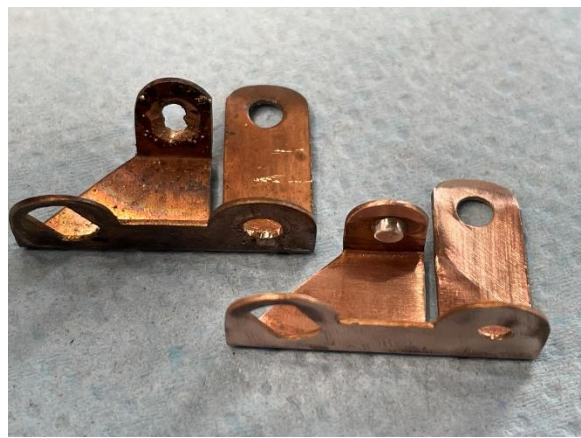
Alt... und.....Neu so sollte es sein