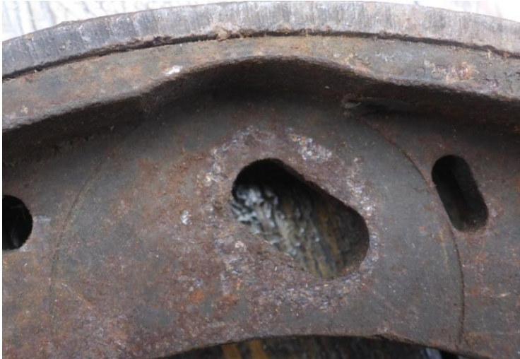
Einfräsung – soll unten liegen