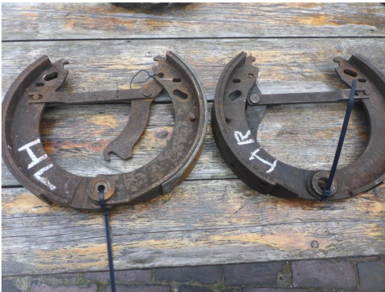
Hintere Bremsbackenpaare links und rechts