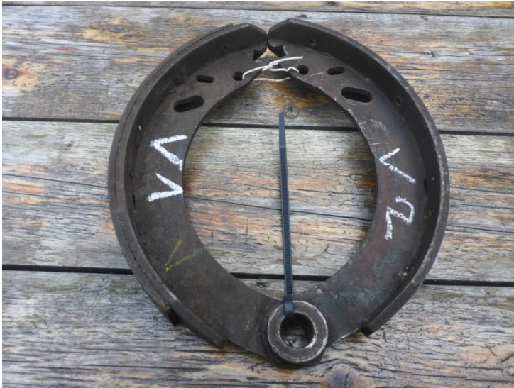
Paar vordere Backen für links und rechts