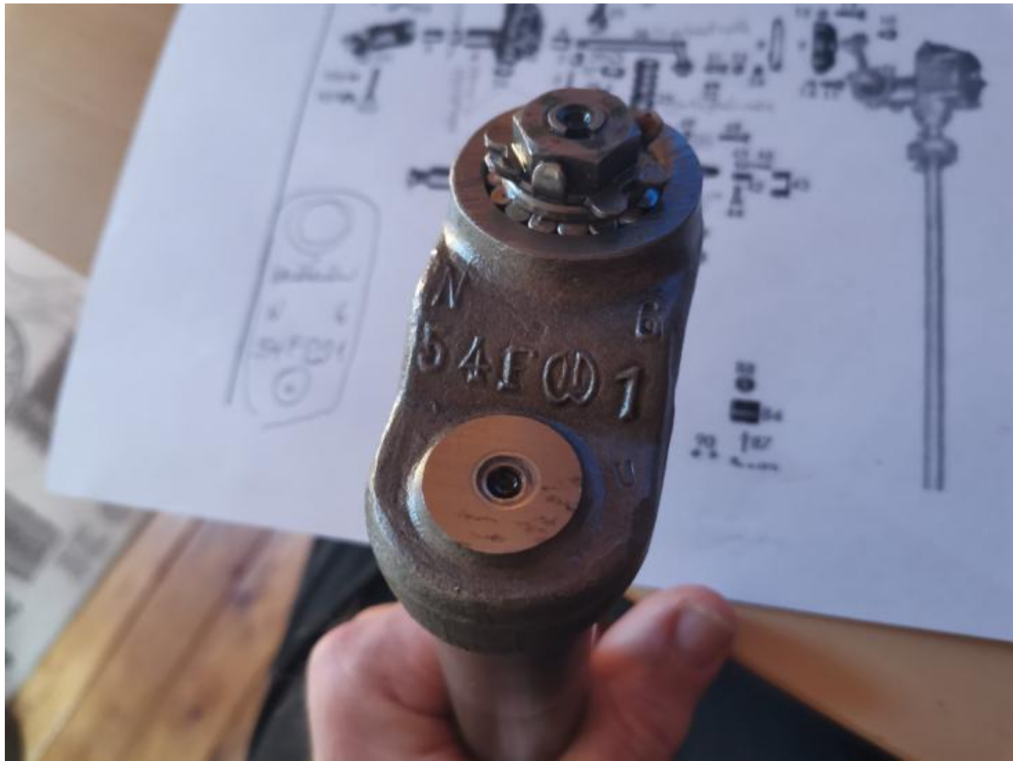
Lenkfinger SKF Typ 542 Werk Schwäbisch Gmünd Roßlenkung in Lizenz TIMKEN