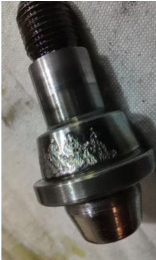
Lenkfinger mit Macke 460 00 12