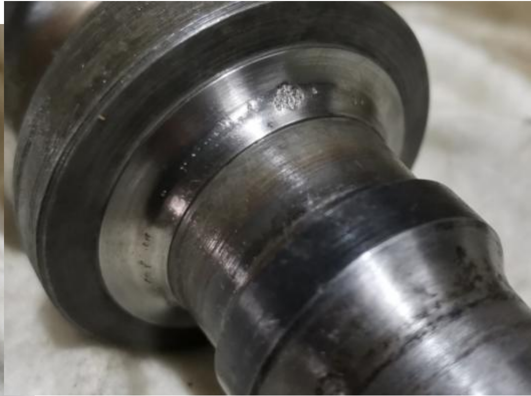
Macke in der Kugellaufbahn Lenkungsschnecke