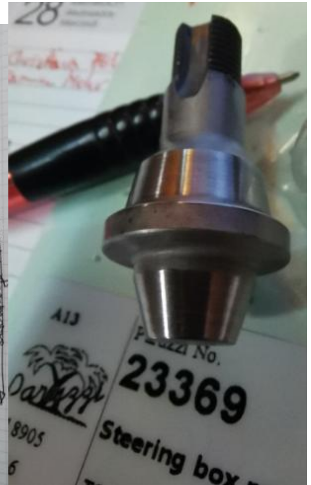
VW T2 steering box peg Passt genau